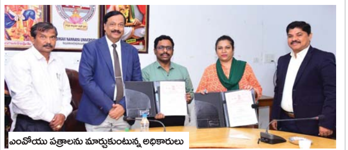
ఎంవోయు పత్రాలను మార్చుకుంటున్న అధికారులు