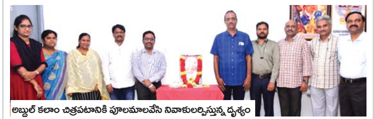
అబ్దుల్ కలాం చిత్రపటానికి పూలమాలవేసి నివాళులర్పిస్తున్న ధ్యక్షం