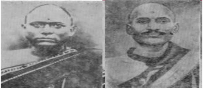
తిరుపతి వేంకట కవులు